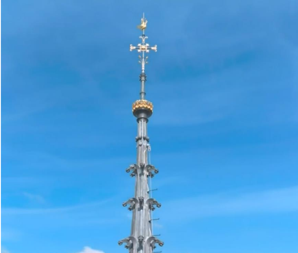
Spitze des neuen Vierungsturms von Notre Dame, Paris

Entschieden und nach fünf Jahren glücklich neu errichtet Glück ist Entscheidung