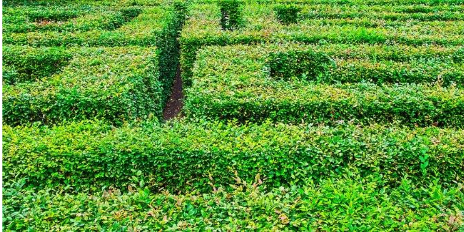
Labyrinth oder Irrgarten?

An dieser Stelle möchte ich eine junge Frau zitieren, die ein jahrelanges Martyrium durchleiden musste, deren Geschichte durch die gesamte Presse ging und die die Kraft gefunden hat, über ihr Schicksal ein inspirierendes Buch zu schreiben. Natascha Kampusch: „... frei sind wir alle nicht – werden es auch nie sein -, aber man kann sich so fühlen. Freiheit ist eine bewusste Entscheidung “. Dahin muss man erst mal kommen, so etwas zu sagen!